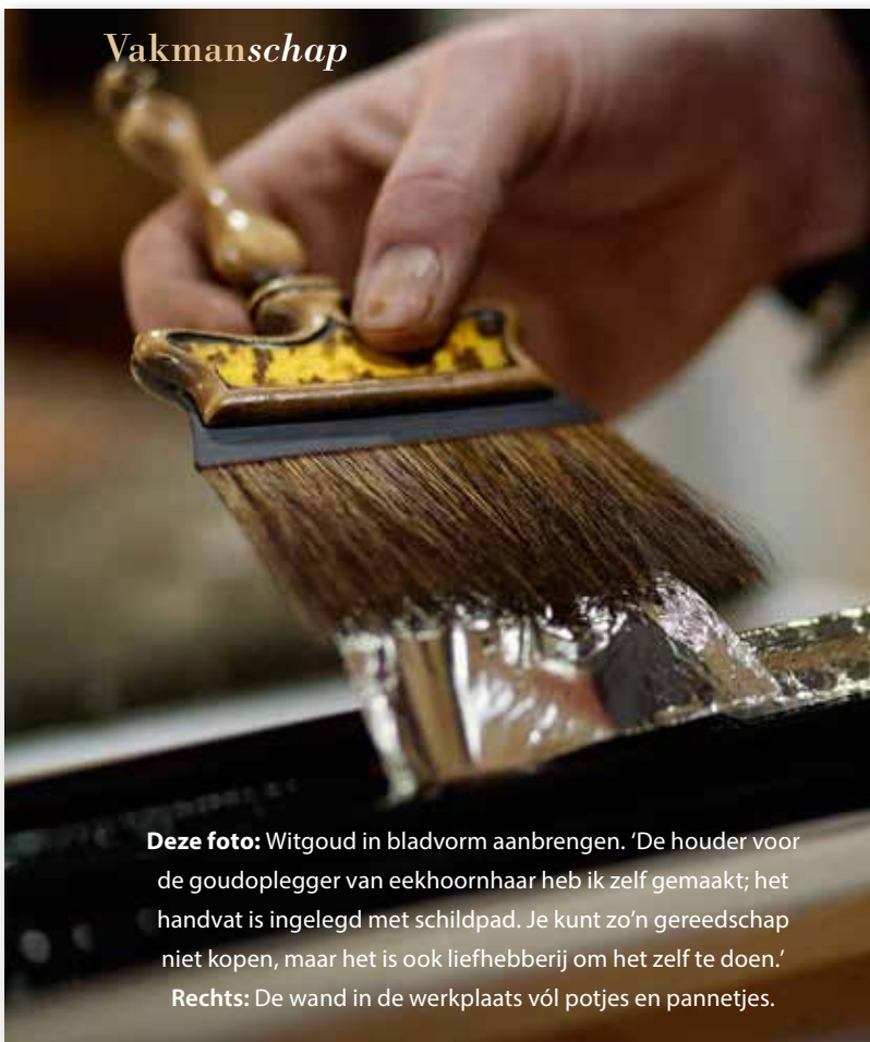
Deze foto: Witgoud in bladvorm aanbrengen. 'De houder voor de goudoplegger van eekhoornhaar heb ik zelf gemaakt; het handvat is ingelegd met schildpad. Je kunt zo'n gereedschap niet kopen, maar het is ook liefhebberij om het zelf te doen.' Rechts: De wand in de werkplaats vól potjes en pannetjes.